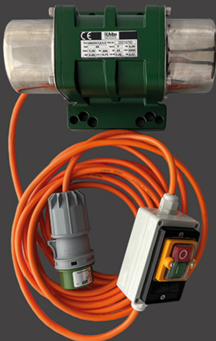
42V inkl. AUS/EIN