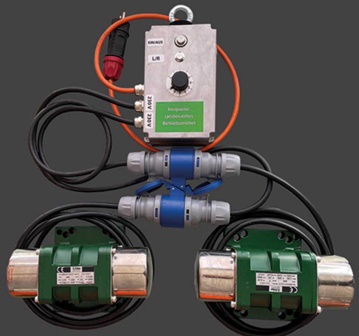
230V 2 Außenrüttler